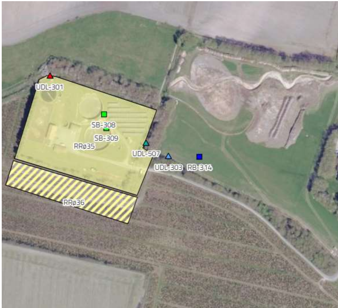
Placering af udløb (UDL-303) og regnvandsbassin (RB-314)

Ved personligt fremmøde: Rådhuset i Vejen, Rådhuspassagen 3, 6600 Vejen